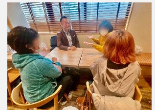
地域のお母さん方に、日頃感じておられる様々なお話を聞かせて頂く茶話会を開催していただきました。