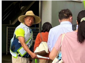
第14回 桜上水 自民議員の海外視察のあり方、秋本元議員の収賄事件が話題に。