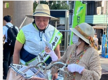
第10回 下高井戸 地域の皆様と対話を重ねる機会を大切にしています。