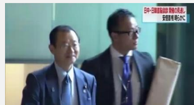
父・河村建夫の衆議院議員秘書として数々の法律案・政策調整に携わる

大学卒業後、衆議院議員河村建夫の政策担当秘書、文部科学大臣秘書官、内閣官房長官秘書官を23年間務める。2005年、東京大学大学院情報学環学際情報学府修士課程を修了。2008年の宇宙基本法の事務方責任者として、河村建夫前議員の活動を支え法案作成を行う。以降の国内全ての宇宙関連法案に携わる。