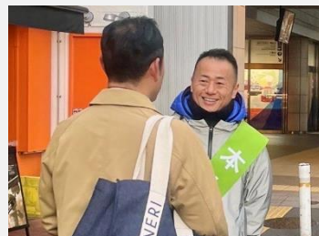
第146回 成城学園前 2024年1月29日。この日、48歳の誕生日を迎えました。