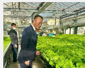
就労移行支援施設「カタミグリーンファーム」訪問。多様な個人の成功のために、政治が寄り添ってお手伝いをしていきます。