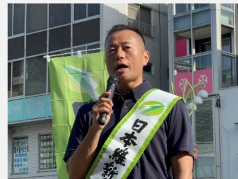
第1回 経堂 2023年7月20日 日本維新の会東京6区支部長に就任後、初めてのご挨拶。