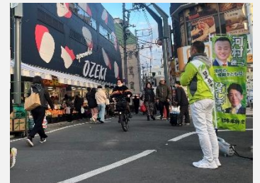
第96回 下北沢 朝だけでなく、お買い物時にも。朝お会いできない方々ともお話しできる場です。