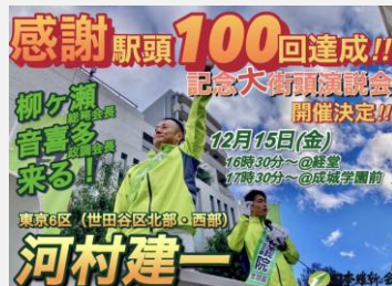
街頭100回感謝大街頭演説会 街頭活動100回目を機に維新の仲間と共に、演説会を初開催。