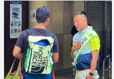
第8回 明大前 早朝から多くの学生が行き交う状況のある学生街。