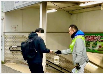
第155回 千歳烏山 政治家の基本は国民との対話。全てが貴重なご意見です。

昨年7月19日に、日本維新の会衆議院東京都第6選挙区支部長に就任以来、毎朝欠かさず選挙区内の駅前立って、ご挨拶をさせていただいております。月曜日は成城学園前、水曜日は経堂、金曜日は千歳船橋、火曜・木曜はそれ以外の駅で活動して、まもなく200回。